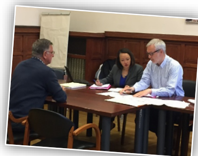
Permanence du 23 mai