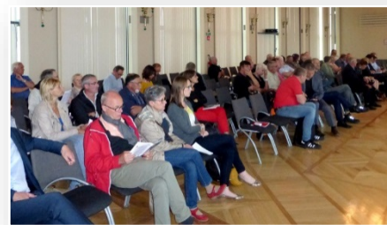
Réunion publique du 31 mai à la CCI de Calais

Chacune des réunions publiques s'est déroulée de la manière suivante :